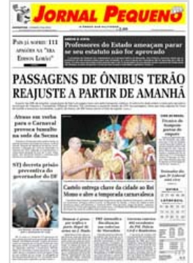
Ano 58 - sexta-feira, 12 de fevereiro de 2009