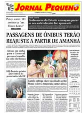
Ano 58 - sexta-feira, 12 de fevereiro de 2009